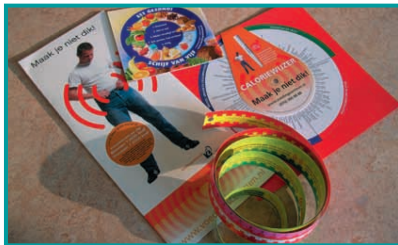
De bestaande materialen van het Voedingscentrum, waarover GGD'en of thuiszorgorganisaties al kunnen beschikken.

Conclusies Uit dit onderzoek is een aantal aanbevelingen naar voren gekomen, die in de toekomst kunnen worden toegepast. Ten eerste zou aan GGD'en en thuiszorginstellingen meer duidelijk moeten worden gemaakt wat deze organisaties in het kader van preventieactiviteiten kunnen betekenen, bijvoorbeeld via actieve mailingen, nieuwsbrieven, publicaties in vakbladen en informatie op de